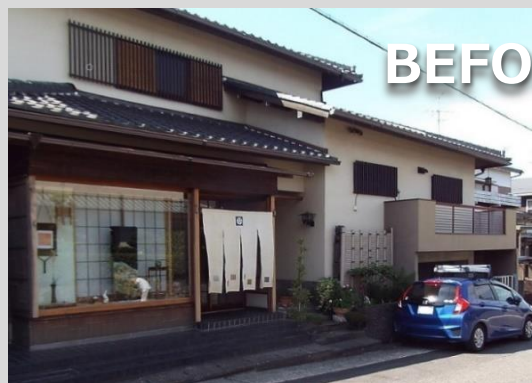
呉服店時の名残を留めた外観 (工事前 既にご閉業)