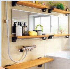
〈クリナップ〉アクリアバス・ユアアシ とってまクリンカウンター

ユニットバスのカウンターがカンタンにお掃除しやすいように各設備メーカー いろいろと工夫されています。 ご購入時の検討項目の1つに加えてみてはいかがでしょうか?