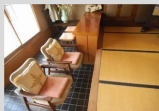
店舗入口の半分は 広い土間でした