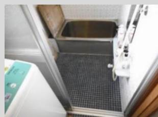
冬寒いタイル貼りの浴室